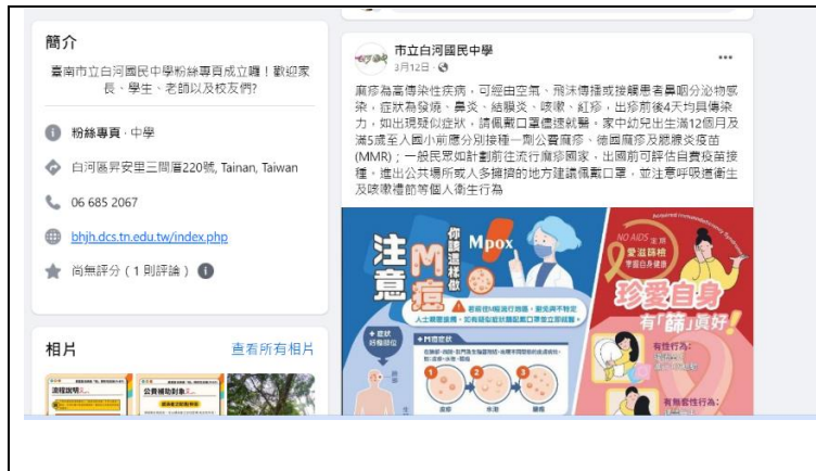
在 fb 宣導健康知識之一