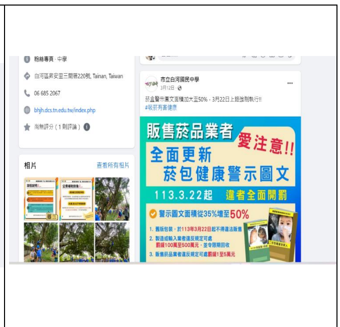
在 fb 宣導健康知識之四