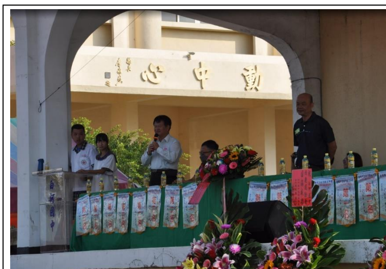
在校慶時文教基金會董事(社區人士)到場共襄盛舉