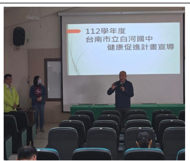
親職教育時也向家長及社區人士倡議健康的重要