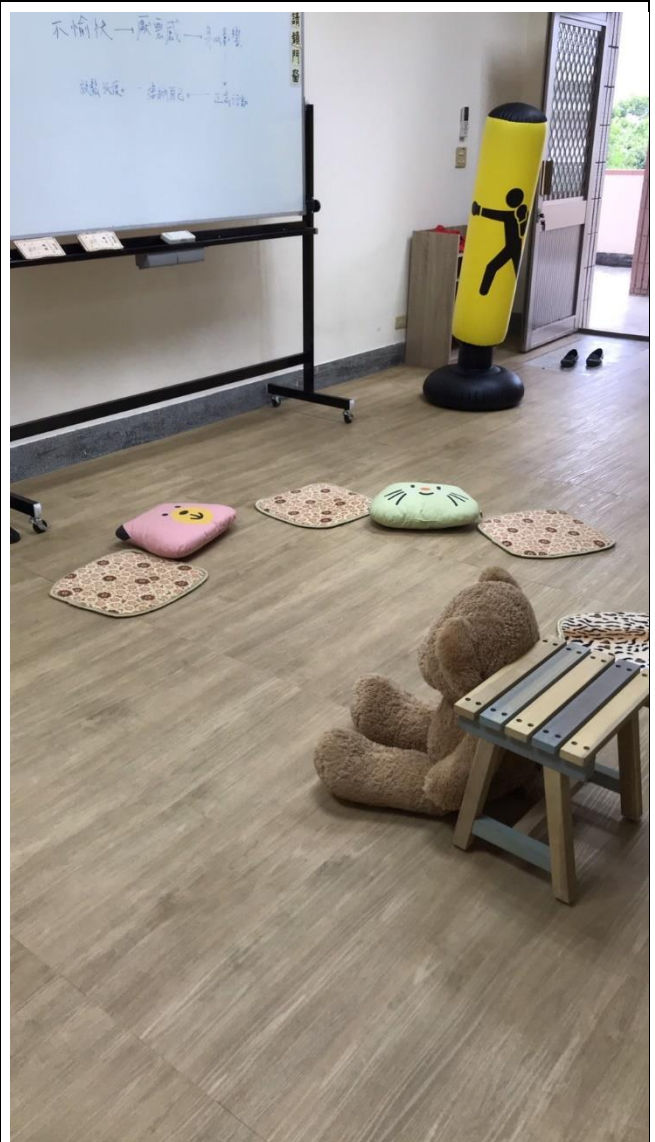
溫馨又舒適的諮商環境