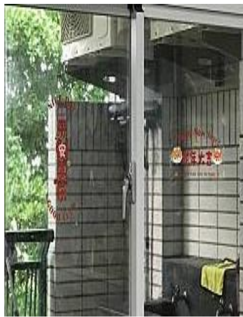
班級的佈置也是兼具知性和感性教育性